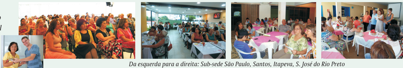
Da esquerda para a direita: Sub-sede São Paulo, Santos, Itapeva, S. José do Rio Preto

Veja como foi a comemoração do Dia Internacional da Mulher pelas Regionais afora: