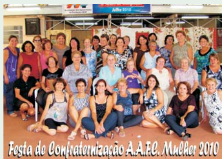
Festa de Confraternização AAFC Mulher 2010

A AAFC-Mulher de Araraquara, realizou no último dia 15/12/2010, uma reunião de final de ano, na sala de eventos da Sede Regional, com a participação de 40 associadas. Tivemos a participação de um duo musical, que graciosamente divertiu a festa, o último aniversário do ano entre as amigas foi coroado com a entrega de lembranças a elas.