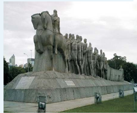
Monumento às Bandeiras - Victor Brecheret