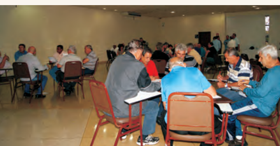
Participantes reunidos, em busca de uma AAFC melhor!

Realizado nos dias 15 e 16 de abril do corrente ano, o II Encontro com os Regionais foi marcado pela colaboração, participação e pró-atividade dos participantes.