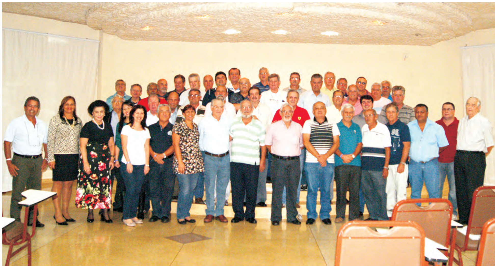
II Encontro com as Regionais traz resultados positivos e conclama os dirigentes a pensarem ainda mais no futuro da nossa instituição.