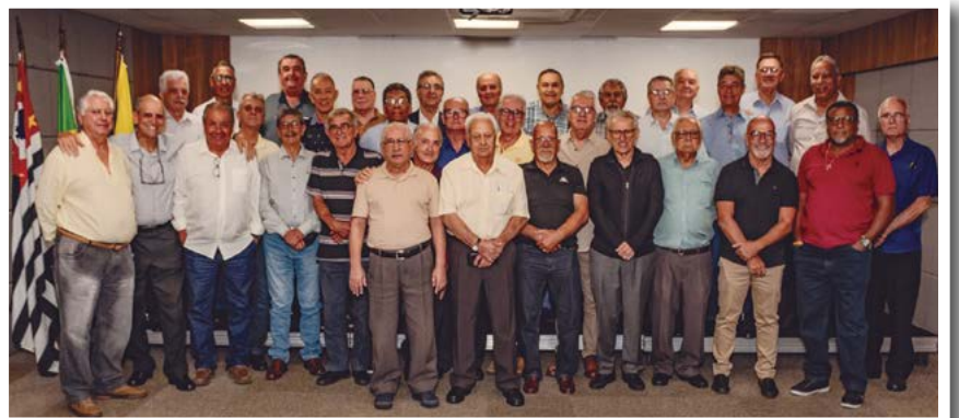
Superintendentes e Suplentes Regionais empossados