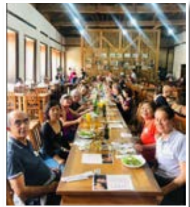
Viagem para Amparo, em 17/02/2024, com parada na Fazenda Atalaia