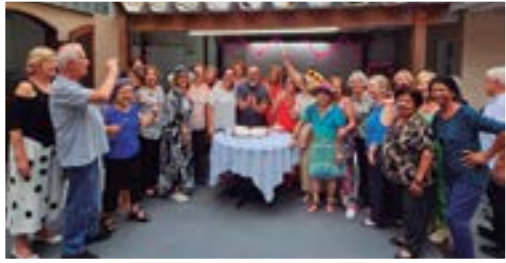
Comemoração do Dia Internacional da Mulher