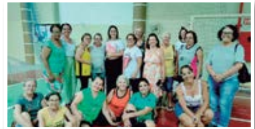
Comemoração do Dia Internacional das Mulheres