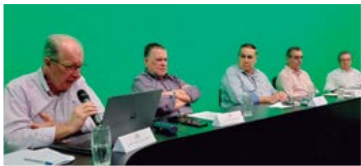
61ª Assembleia Geral Extraordinária

Ocorridas no mês de abril, as Assembleias da AAFC aprovaram as matérias das Ordens do Dia, apresentadas nas 61ª AGE, no dia 13, e 62ª AGO e 63ª AGE, no dia 25.