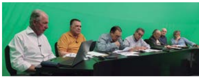
62ª Assembleia Geral Ordinária e 63ª Assembleia Geral Extraordinária

A 61ª Assembleia, da qual participaram 76 associados, aprovou a Propositura de ação judicial coletiva através do Escritório Innocenti Advogados Associados, a ser ajuizada contra a CTEEP e todos os Sindicatos que com ela negociaram os Acordos Coletivos de Trabalho a partir da data base de 2020/2021 e as subsequentes, visando a declaração de ineficácia da exceção contida no parágrafo primeiro da cláusula 4ª dos referidos Acordos Coletivos de Trabalho, para os complementados associados participantes do Plano Previdenciário 4819, bem como a condenação da CTEEP ao pagamento das diferenças, em