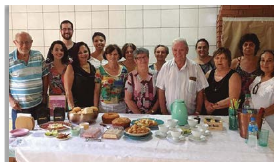
Em Primavera, uma bela homenagem às mulheres

Além disso, os participantes se divertiram com o sorteio de brindes!