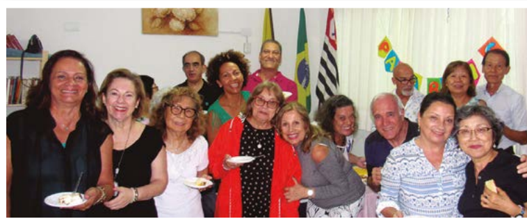
Comemoração aos aniversariantes de janeiro e fevereiro