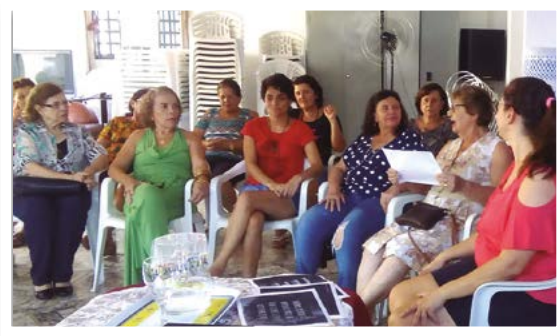
Mulheres de Itapeva comemoram seu dia

Além dos esclarecimentos a respeito dos complementados e suplementados, a reunião se transformou em um belo reencontro com os amigos!