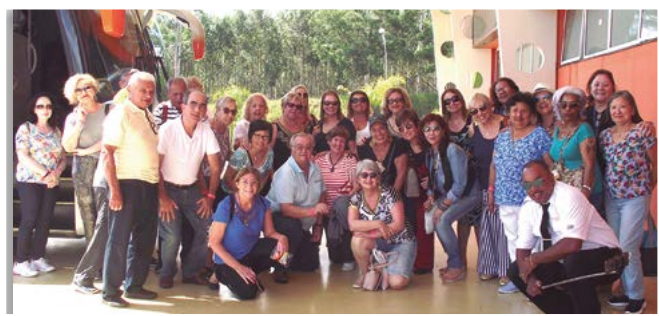
Visita ao santuário de aparecida do norte em 20/02/19