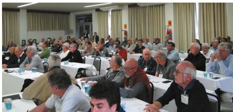
Participantes do Encontro

Em Encontro realizado durante os dias 11 e 12 de junho p. passado, as principais lideranças da AAFC reuniram-se em Águas de Lindóia com o objetivo de alinhar diretrizes, nivelar conhecimentos, operacionalizações das atividades realizadas pela AAFC, além de integrar o corpo diretivo, por ocasião da gestão que se iniciou em maio.