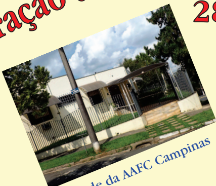
Sede da AAFC Campinas