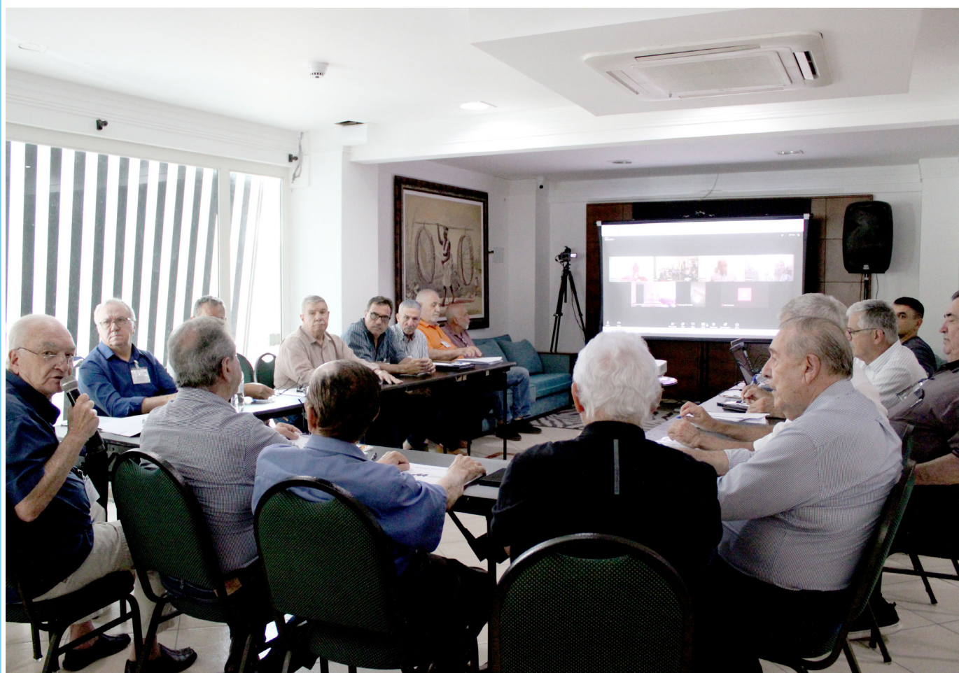
Encerrando a programação, os Conselhos se reuniram em sessão própria.