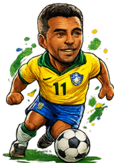
Romário 55 gols