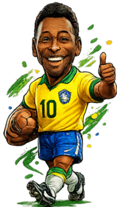
Pelé 77 gols