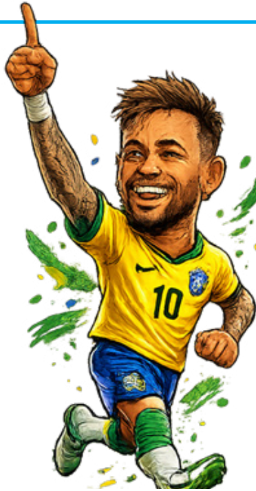
Neymar 79 gols