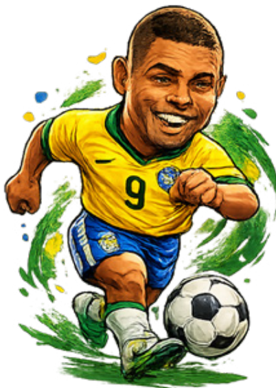
Ronaldo 62 gols