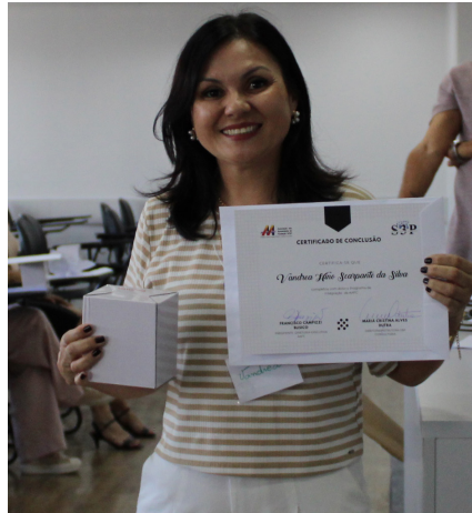
Vandrea - Primavera