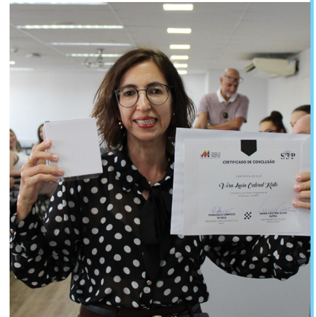
Vera - Ilha Solteira