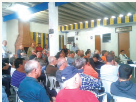
Com presença maciça, associados ouviram atentamente aos palestrantes

Fechamento do plano para novas adesões. No encontro, participaram quase 100 associados e foram abordados temas como a duração e a transformação do contrato previdenciário e as influências externas sobre a entidade gestora, bem como os impactos do fechamento do plano para os assistidos da Eletropaulo.