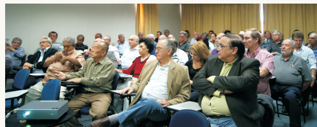
A plateia atenta ao discurso

Foram discutidos temas sobre previdência complementar e capitalização; taxa de juros e planos de benefícios; impacto da redução da SELIC e como lidar com o novo cenário dos fundos de pensão.