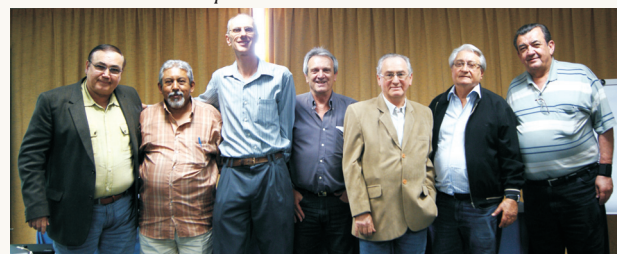
Idealizadores da palestra com o palestrante