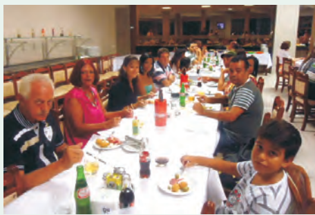
Presidente Prudente levou muitos participantes para sua festa, que contou com vários brindes e animação