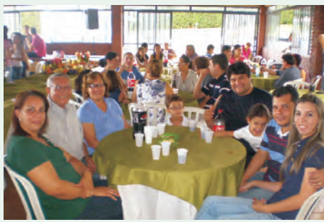
Flash de Maringá, realizada dia 16/12/12, na Chácara Regiamar,