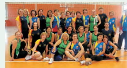
Rio Claro se encontrou com Campinas e Bauru em agosto