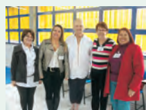
Aposentadas de Piracicaba e Rio Claro, respectivamente

A avaliação das participantes foi positiva em todos os aspectos.