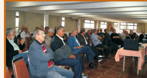
Platêia atenta e participativa: fundamental para o sucesso do Encontro