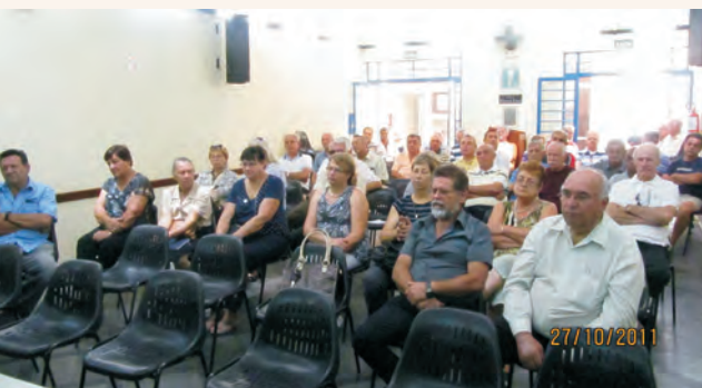
Reunião na Regional de Rio Claro