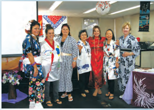
Colaboradoras da AAFC-Mulher no dia da "Cultura Japonesa"