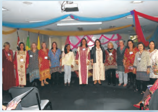
Todas no clima da "imigração árabe"