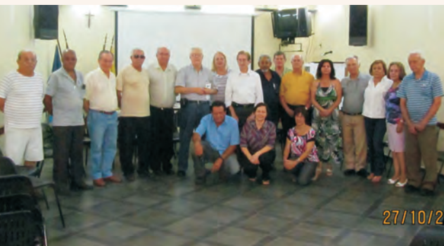
Reunião com a equipe técnica da AAFC – Regional de Rio Claro