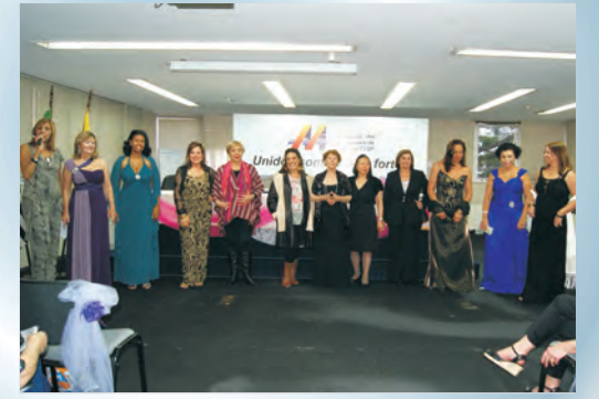
Após o desfile da "Oficina Fashion"