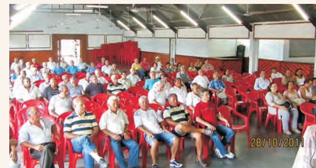
Reunião na Regional de Bauru

As reuniões ocorreram com a participação de cerca de 150 associados em cada um dos dias, que acompanharam a apresentação da Presidência e Diretoria da AAFC acerca dos últimos acontecimentos referentes aos Planos de Suplementação, às Ações de Bitributação do Imposto de Renda e Revisão pelo Teto do INSS, bem como a situação das Ações do Plano 4819.