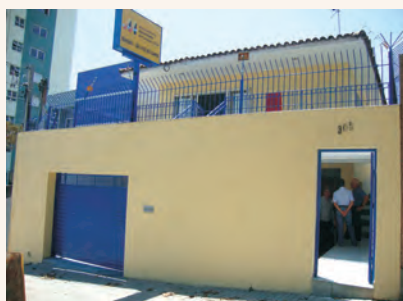
Nova Sede já pintada com as cores da AAFC