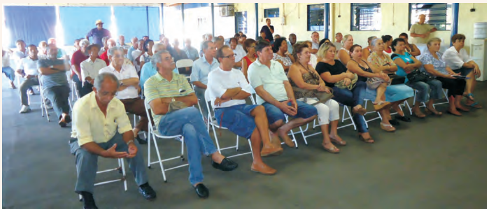
Reunião com os associados