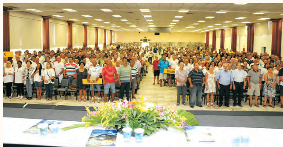
Cerimônia de encerramento