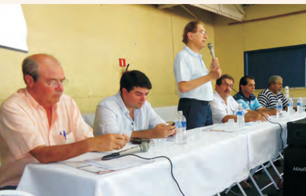
Reunião com os associados