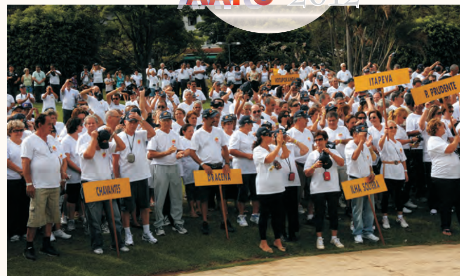
Abertura das Olimpíadas AAFC 2012

Maiores detalhes publicaremos na próxima edição do Jornal do Sênior .