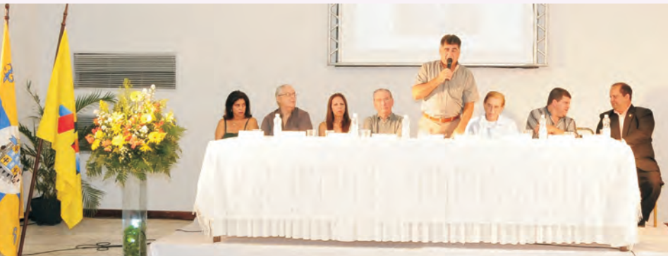
Cerimônia de abertura do Seminário, Vice-Prefeito de Águas de Lindóia dirigindo-se aos participantes do evento

O II Seminário da AAFC-Mulher, sob o tema “Viver a vida com leveza e qualidade”, realizado em Águas de Lindóia, de 06 a 09 de março de 2012, contou com a parti-