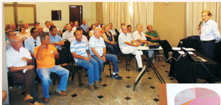
Reunião com os associados