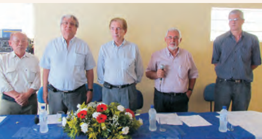
Mesa composta para cerimônia de inauguração