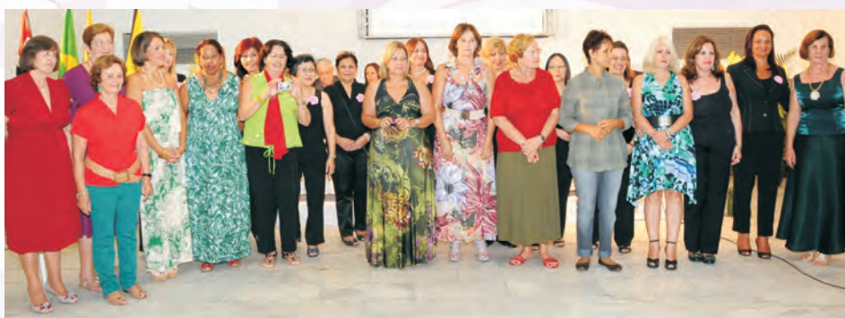
Coordenadoras da AAFC-Mulher das Regionais e da Sede, na abertura do evento