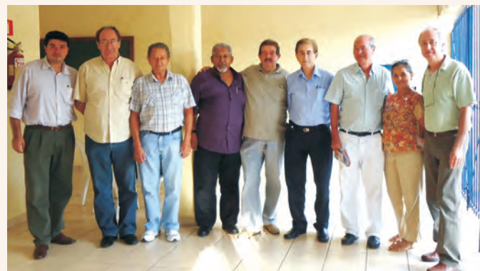
Equipe da Sede da AAFC com a equipe da Regional para realização da Reunião Técnica