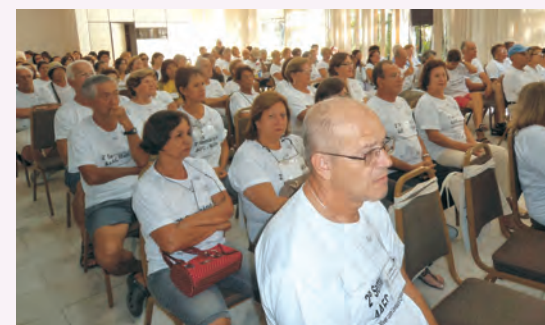
Participantes do Seminário