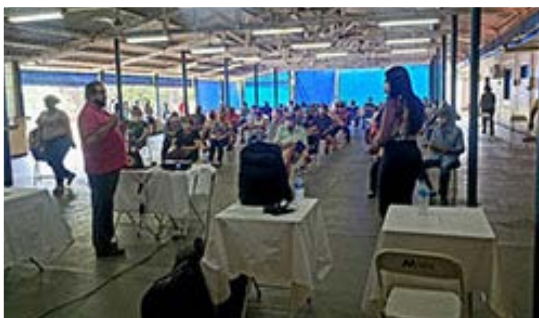
Primavera: Interesse no assunto levaram mais de 100 participantes à reunião ocorrida em 06/10, no Distrito de Primavera!

Visita às Unidades para tirar dúvidas quanto à migração do plano CESP