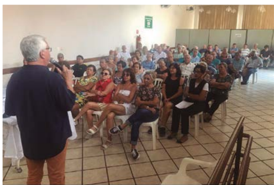
AAFC Ribeirão Preto - Reunião mensal - Janeiro de 2020