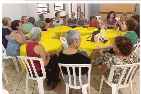
AAFC Ribeirão Preto - AAFC Mulher - Reunião Fevereiro de 2020