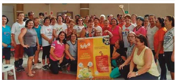
Palestra "Saúde do cérebro", com a empresa Supera