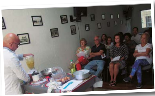
Aula de culinária