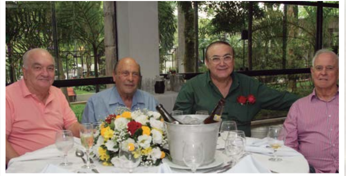
Membros do Conselho Deliberativo da AAFC

Diretores, funcionários e familiares: confraternização completa