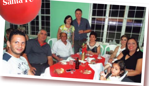
Distrito em festa