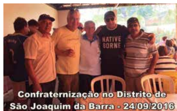
Confraternização no Distrito de São Joaquim da Barra - 24/09/2016