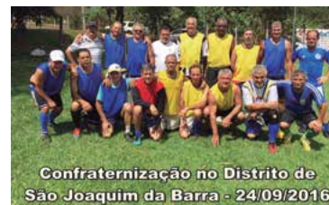
Confraternização no Distrito de São Joaquim da Barra - 24/09/2016

A Regional de Ribeirão Preto promoveu mais um encontro de confraternização juntos aos distritos, comparecendo desta vez no Distrito de São Joaquim da Barra no dia 24 de setembro passado, onde a delegação regional foi muito bem recebida pelos amigos associados daquele distrito.