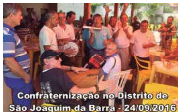
Confraternização no Distrito de São Joaquim da Barra - 24/09/2016