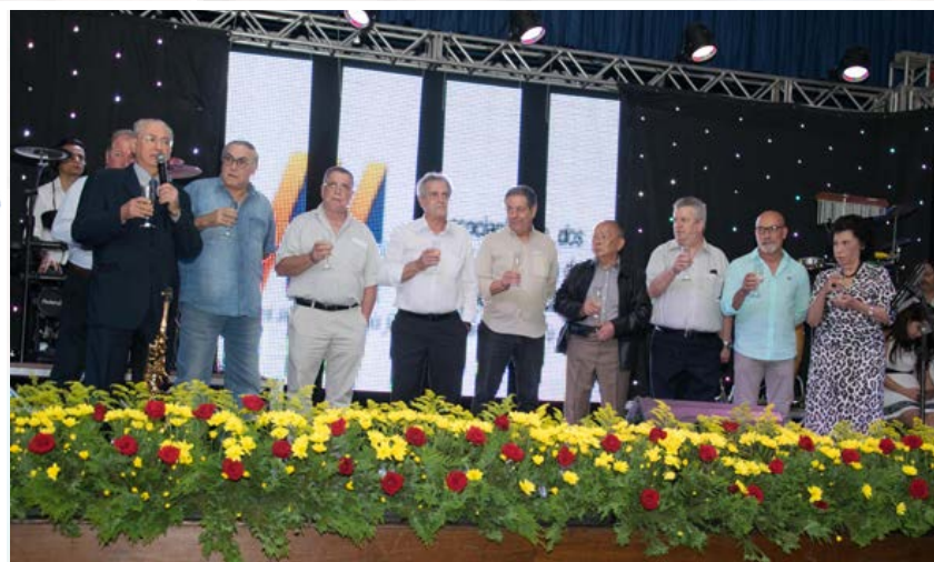
Membros da Diretoria Executiva brindam à chegada de um novo ano!