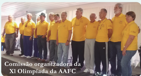
Comissão organizadora da XI Olimpíada da AAFC