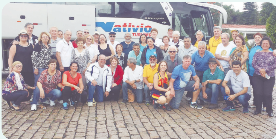
Participantes de Rio Claro na XI Olimpíada da AAFC

Parabéns a Comissão Organizadora, pela forma que conduziu os trabalhos, desde a elaboração dos jogos, regras e tabelas e toda organização do evento.