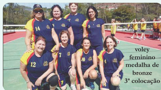
voleibol feminino medalha de bronze 3ª colocação

Encerrou-se com muito sucesso a XI Olimpíada AAFC 2016, realizada no período de 15 a 19 de maio, na cidade de Serra Negra, com a participação das 19 Regionais.