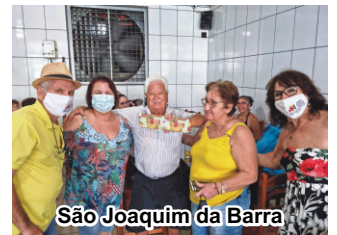
São Joaquim da Barra