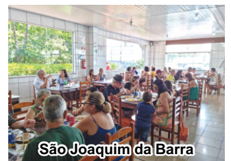
São Joaquim da Barra