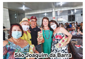
São Joaquim da Barra