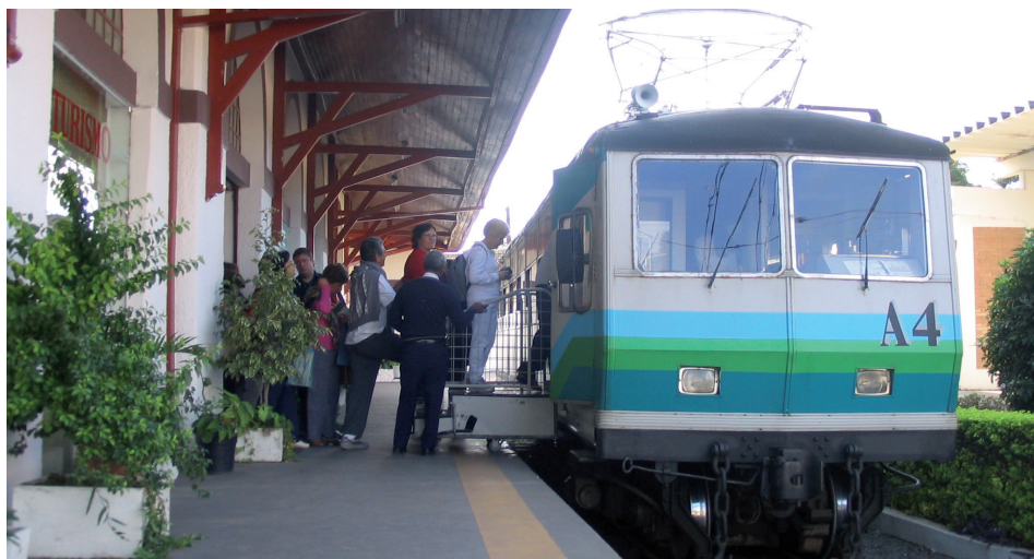
Trem Pindamonhangaba - Campos do Jordão

Fazenda Nova Gokula - Pindamonhangaba-SP