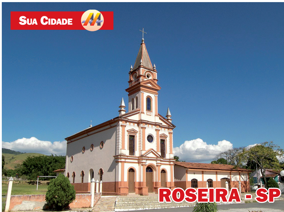
IGREJA N. SRA DA PIEDADE FUNDADA 1900

O povoado que deu origem ao município de Roseira surgiu por volta do séc. XVIII, às margens do Caminho Real que ligava São Paulo ao Rio de Janeiro, onde se localiza o bairro de Roseira Velha. O povoado surgiu em torno da Capela de Nossa Senhora do Rosário, hoje Nossa Senhora da