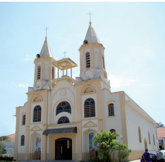
Igreja Matriz de Sant'ana é uma das mais bonitas da região

Em relação a vegetação, Roseira pode ser classificada como Mata Atlântica de Várzea do Paraíba do Sul. Inicialmente, era coberta pela floresta "Pluvial Tropical", atualmente é ocupada, quase na totalidade, pela rizicultura e cultura de hortaliças, plantio de eucaliptos, pastagens e vegetação secundária. Dentro da área de Proteção Ambiental de Roseira Velha, às margens do Rio Paraíba e em alguns pontos isolados de preservação, podemos encontrar mata nativa, vestígios de Mata Atlântica, de formações arbóreas, frutíferas, arbustivas e herbáceas.