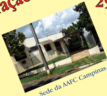
Sede da AAFC Campinas