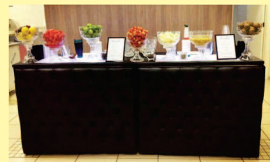
Bar & Cia Bartenders