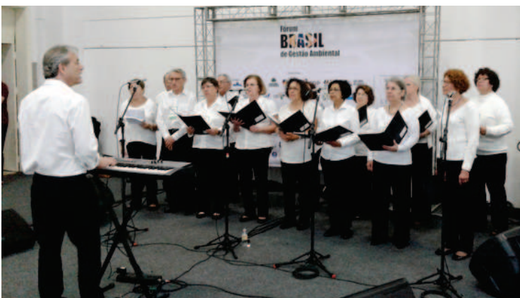
Apresentação no Shopping D. Pedro