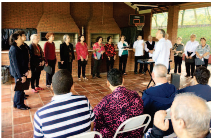
Apresentação no APABEX

Em 10/07/2017 apresentamos várias músicas no Forum Brasil de Gestão Ambiental, no Shopping Dom Pedro, a convite dos organizadores do evento, que tratou dos assuntos relacionados com o Meio Ambiente, Saneamento Básico no Brasil, Despoluição das Águas, entre outros.