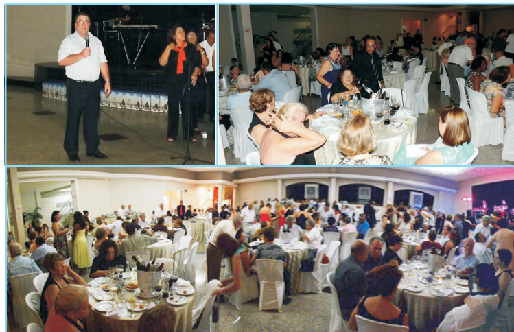
Fotos do evento

Parabenizamos a todos que colaboraram para o brilhantismo deste evento, que mais uma vez reuniu o grupo de associados numa festa de confraternização e amizade.