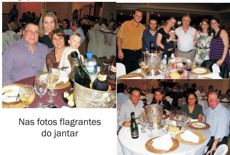
Nas fotos flagrantes do jantar